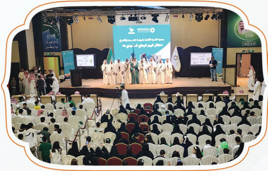
الاحتفال باليوم الوطني 94